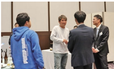
オープン例会の様子