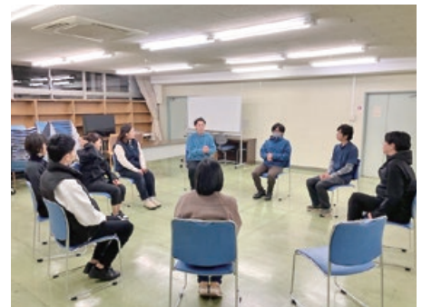
専門家派遣の様子

参加した組合員からは、「今後の仕事に対する姿勢や組織内での人間関係づくりについて学べた」などの意見があり、非常に有意義なものとなった。