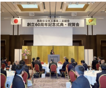
創立60周年記念祝賀会