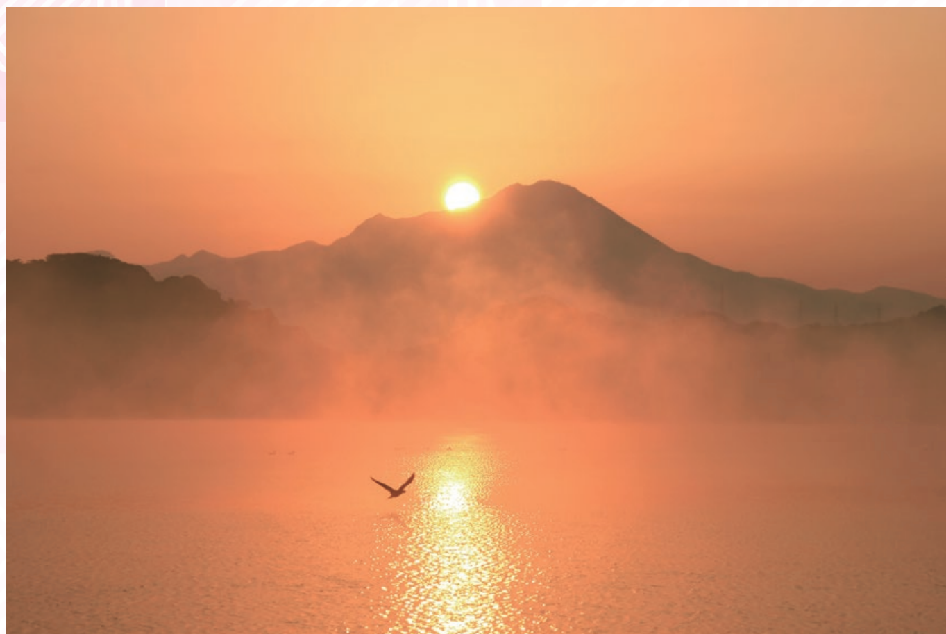
「朝日（平成20年度鳥取県写真コンクール共催者賞作品）」