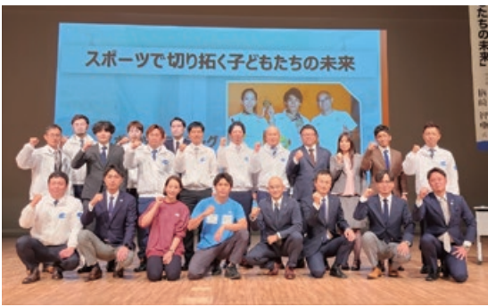
会員・講師での集合写真