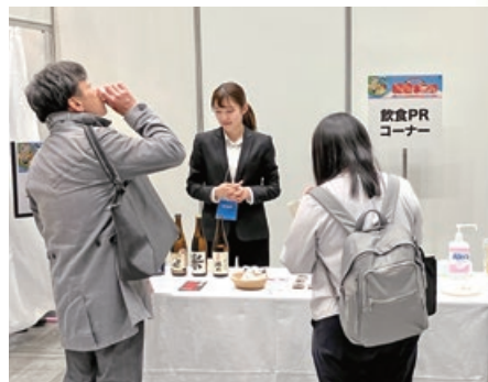
試飲・試食コーナー