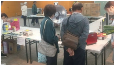
家電即売会の様子

や選び方、メンテナンスのやり方など消費者の悩みに対しアドバイスを行い、会員企業のPRのほか顧客獲得を目指した取り組みを図った。このほか、クリーニングやミニ四駆体験など子供向けの企画を計画し、300名を超える多くの来場者で賑わった。