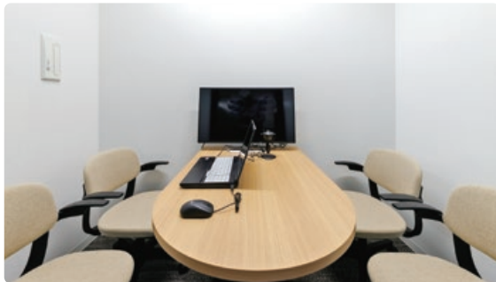
オンラインルーム (内部) 最大収容人数：4名×2部屋