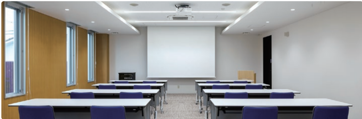
研修室 最大収容人数：30名程度 プロジェクター、スクリーン、音響、Wi-Fi設置

「研修室」「オンラインルーム」については、会員組合やその構成員、県内中小企業等に対し当面の間無料で貸し出す予定です。