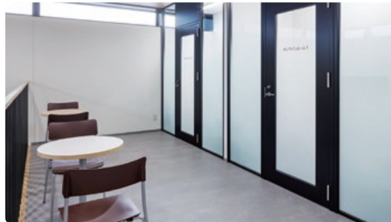
オンラインルーム PC、マイク、Webカメラ常設

本会BCPに準じ、近隣河川の万一の氾濫に備え「資料室」や「サーバールーム」を2階に設置し非常食や小型発電機等の防災品も準備しています。