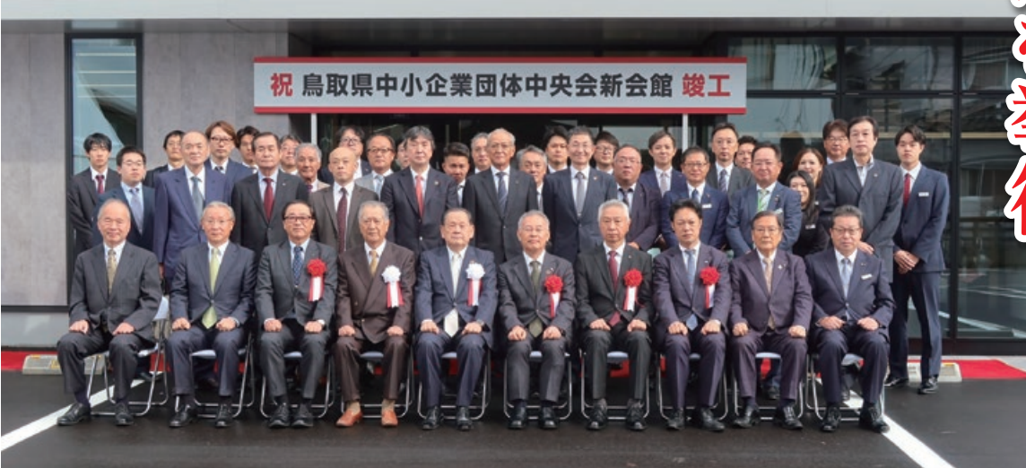
竣工式参列者集合写真