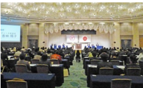
全国フォーラムの様子

引き続き交流会が開催され全国の女性部メンバーと交流しそれぞれのネットワークの拡大を図った。(総務部 倉持)