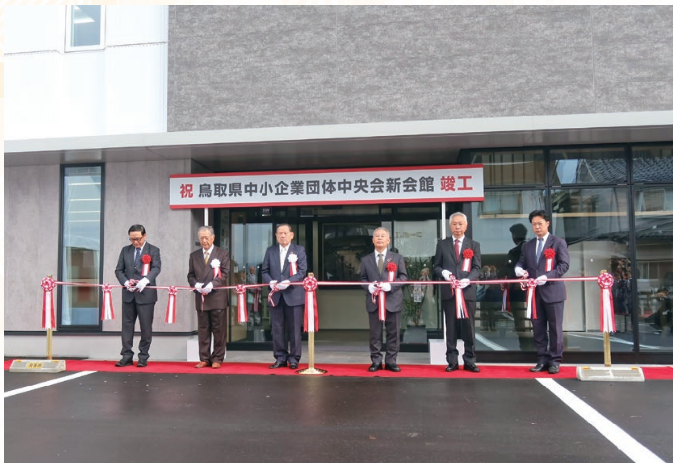
「中央会新会館竣工式」