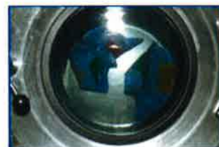
型崩れを起こさない 新たな洗浄方法

顧客情報を電子カルテ化し、顧客の生活環境に合った衣料品のメンテナンスサービスを提供するとともに、水洗いとドライの長所を併せ持つ洗浄方法の開発により、新規需要を開拓します。